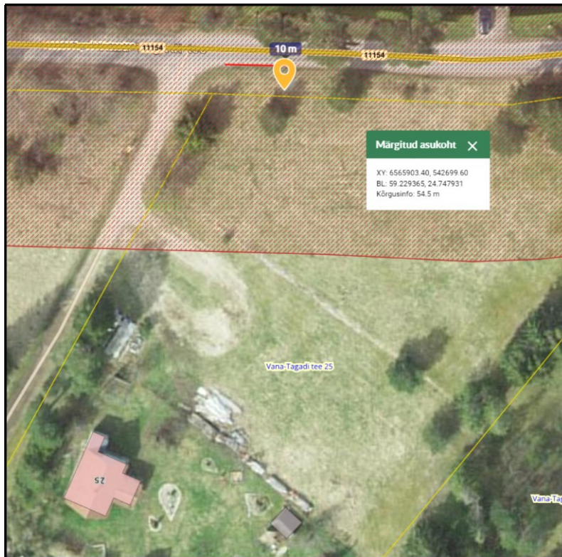
Joonis 1. Ristumiskoha asukoht tähistatud oranži tingmärgiga